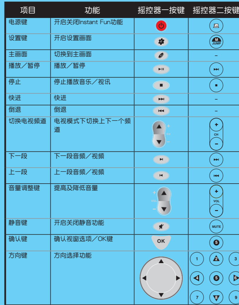
表二：键盘热键说明